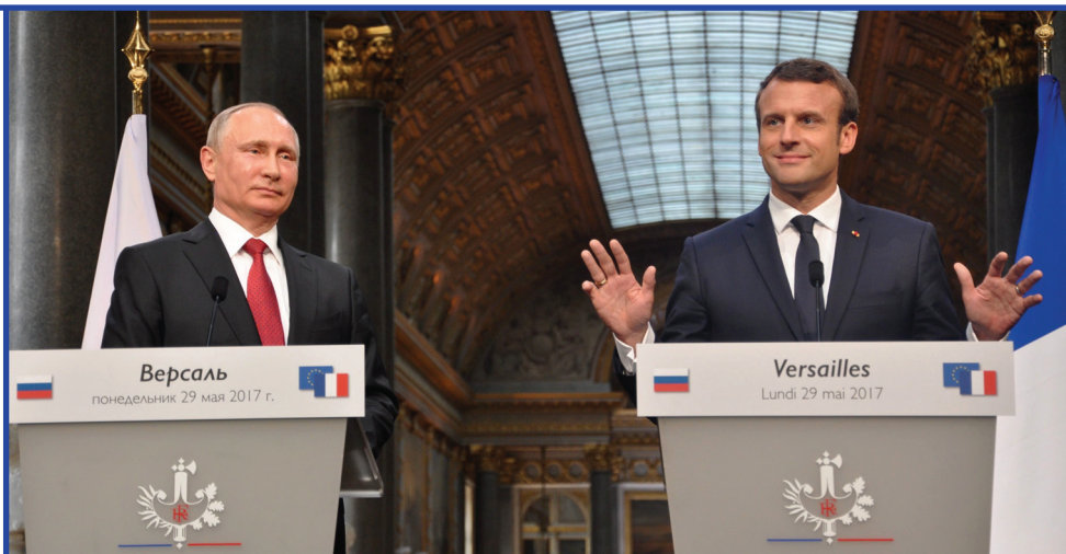
Совместная пресс-конференция Президента Российской Федерации Владимира Путина с Президентом Франции Эммануэлем Макроном, Версаль, Франция, 29.05.2017

29 мая 2017 года Президентом Российской Федерации В. В. Путиным и Президентом Французской Республики Э. Макроном была достигнута договоренность о создании новой площадки двустороннего взаимодействия по линии гражданских обществ — форума Трианонский диалог.