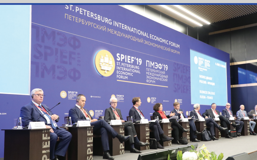
Сессия «Бизнес-диалог Россия — Франция»

По инициативе Трианонского диалога впервые прошла сессия с участием председателей диалогов России с Германией, Францией и Австрией — «Триалог диалогов. Петербургский, Трианонский, Сочинский».